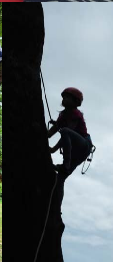
Fotografie z jednotlivých akcí a zájmových činností jsou pravidelně vystavovány v Ulitě a na www.ulita.org/galerie